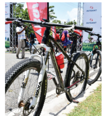
Con la peatonalización en el Malecón, el Intrans iniciará la celebración.

Finalmente, el domingo 29, el cierre de la Semana Movilidad Sostenible habrá peatonalización en el Ensanche Naco, y en el Distrito Nacional. ● elCaribe