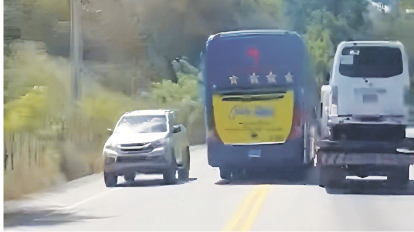
El vehículo de Caribe Tours fue detectado mientras se desplazaba poniendo en riesgo la vida del conductor y de otras personas en la vía pública.

La institución oficial aseguró en su comunicado de prensa, que se detectó que la empresa Caribe Tours no presentó en su listado, el vehículo modelo Volvo, de placa 1105322, color blanco, año 2012, por lo que no figura en los registros.