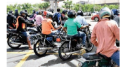
Cada día son más la cantidad de paradas de motores.

El Caribe, pág 2-15 edición impresa 12-09-2024